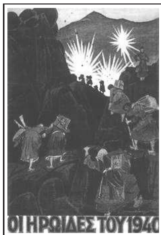
Γυναίκες της Πίνδου (έγχρωμη λιθογραφία, 1940)