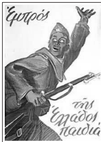
Έμπρός της Ελλάδος παιδιά! (έγχρωμη λιθογραφία, 1940)